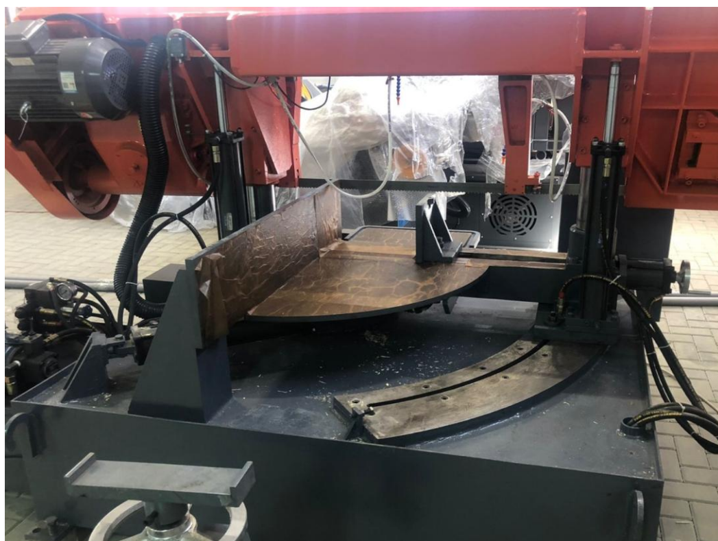
Гидравлические тиски. Поворот рамы осуществляется с помощью гидроцилиндра.