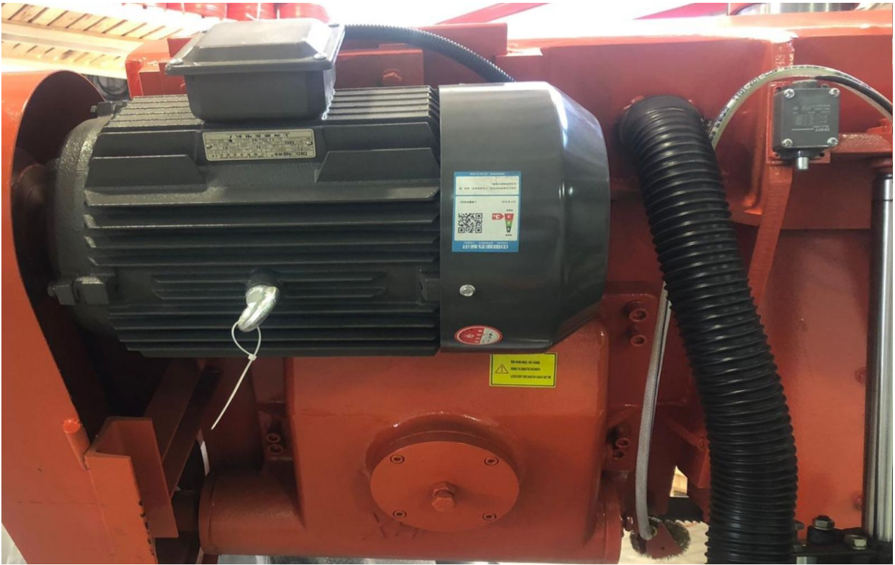
Станок оснащен 5кВт электродвигателем.