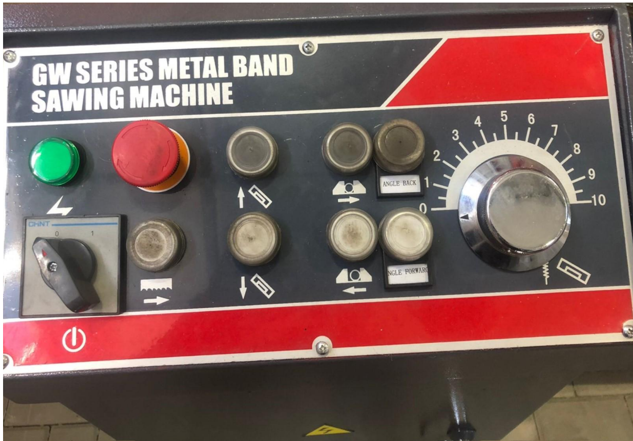
Пульт управления ленточнопильным станком.