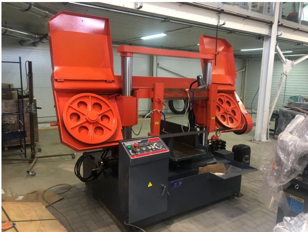
Двухколонный ленточнопильный полуавтомат с параметрами реза 400mm x 600mm.